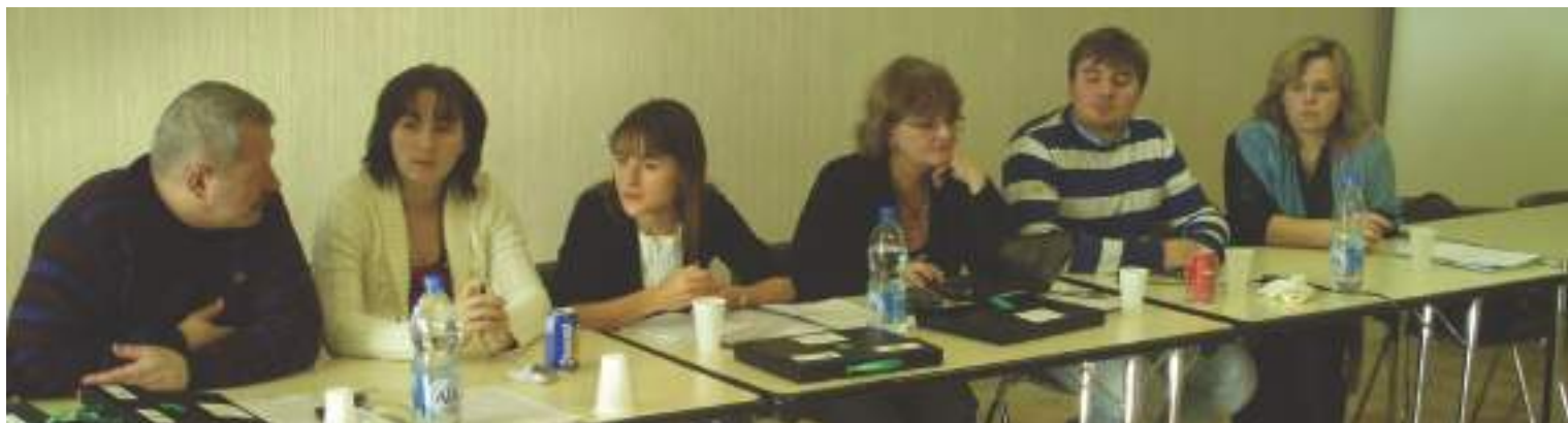
Študenti sociálnej práce okrem svojej účasti v Študentskej vedeckej a odbornej činnosti spolupracujú s OZ EDUKOS Dolný Kubín na niekoľkých medzinárodných projektoch, napríklad Compares a Network. Na snímke slovenskí zástupcovia na stretnutí partnerov projektu v decembri 2009 v Etcharry vo Francúzsku.

Predstavy každého študenta o prínose univerzity pre jeho nielen odborný, ale aj profesionálny rast a s nimi spojené ciele, ktoré chce dosiahnuť, sa počas štúdia postupne dotvárajú, resp. menia. Úlohu mentora v tomto zložitom procese by mali na akademickej pôde zohrávať najmä vyučujúci alebo vedeckí pracovníci zabezpečujúci výučbu a pracujúci na aplikovanom výskume. Úspech tohto procesu je ale založený na vzájomnej dôvere, chuti a snahe napredovať a – dostatku príležitostí. Preto okrem zapájania excelentných študentov do domácich aj zahraničných projektov majú študenti, ktorí chcú dosiahnuť viac, šancu ukázať svoje kvality aj vďaka iným aktivitám. Jednou z možností, ktorá závisí iba od ich cieľavedomosti a chuti popasovať sa so zvoleným problémom, je zapojiť sa do študentskej vedeckej a odbornej činnosti (ŠVOČ).