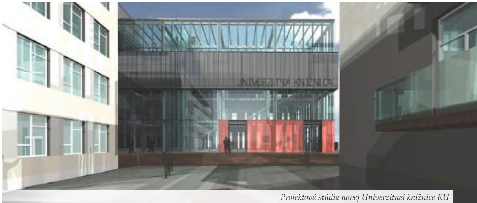
Projektová štúdia novej Univerzitnej knižnice KU