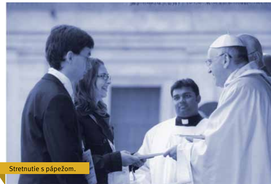
Stretnutie s pápežom.

Počas môjho pobytu som sa dostala do Centra sv. Vavrinca, ktoré založil sv. Ján Pavol II. pre mladých. Pracovala som tu nie len s mladými, ale robila som aj dobrovoľníčku vo Vatikáne, blízko sv. otca. Pre mňa je to ešte stále také tajomstvo, ktorému veľmi nerozumiem, ale prinieslo mi to veľmi pekné spomienky. Také jedinečné momenty boli, keď som sa mohla osobne stretnúť s obidvoma pápežmi: pápežom Benediktom XVI. (s tým ale fotku nemám) a pápežom Františkom. Keďže som tam bola práve v období, keď sa pápeži menili, situáciu som prežívala