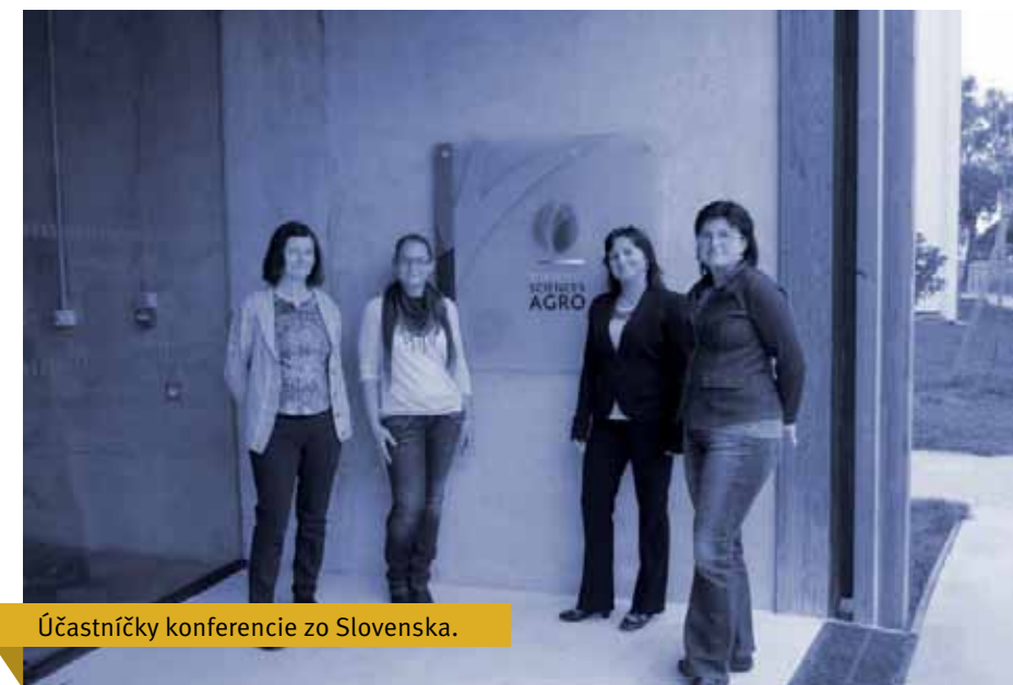
Účastníčky konferencie zo Slovenska.

PF KU je od roku 2014 zapojená do projektu COST Zosúladovanie prístupov pre analýzu politík súvisiacich s lesníctvom v Európe (COST Action FP1207 – Orchestrating forest-related policy analysis in Europe (ORCHESTRA)).