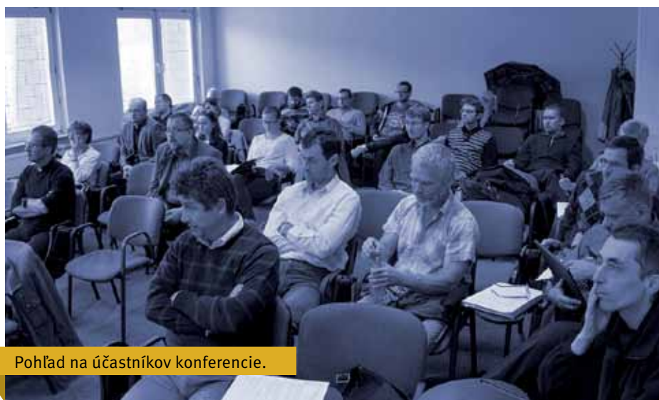
Pohľad na účastníkov konferencie.