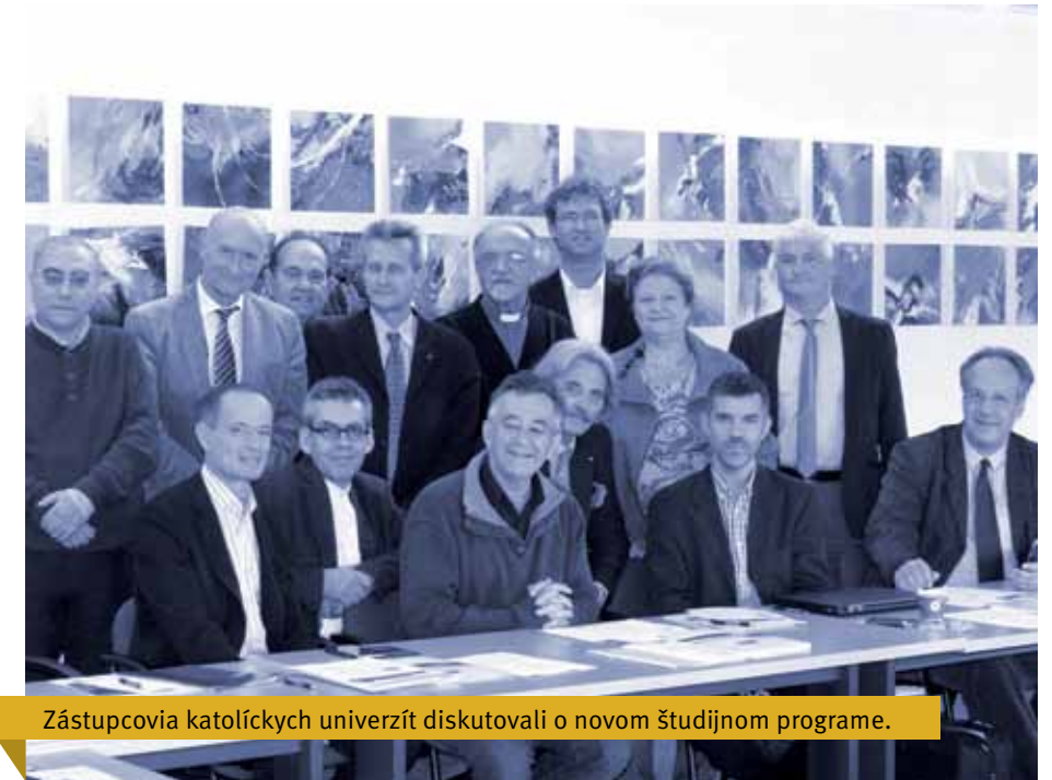
Zástupcovia katolíckych univerzít diskutovali o novom študijnom programe.