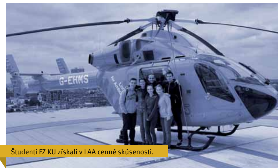
Študenti FZ KU získali v LAA cenné skúsenosti.