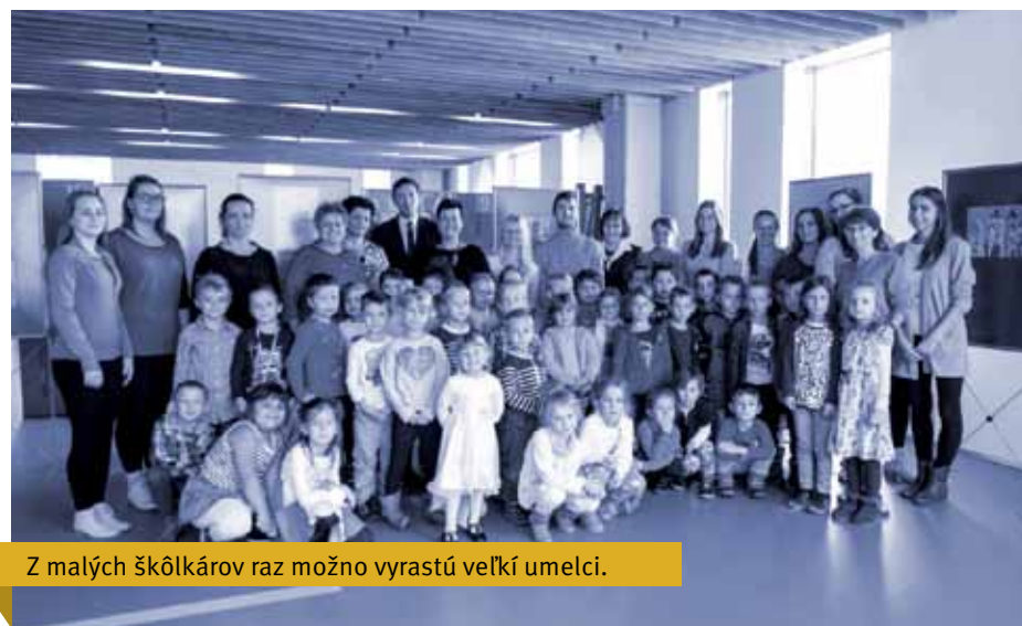
Z malých škôlkárov raz možno vyrastú veľkí umelci.