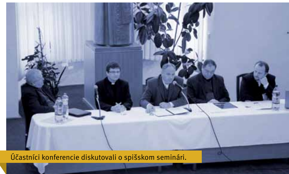
Účastníci konferencie diskutovali o spišskom seminári.