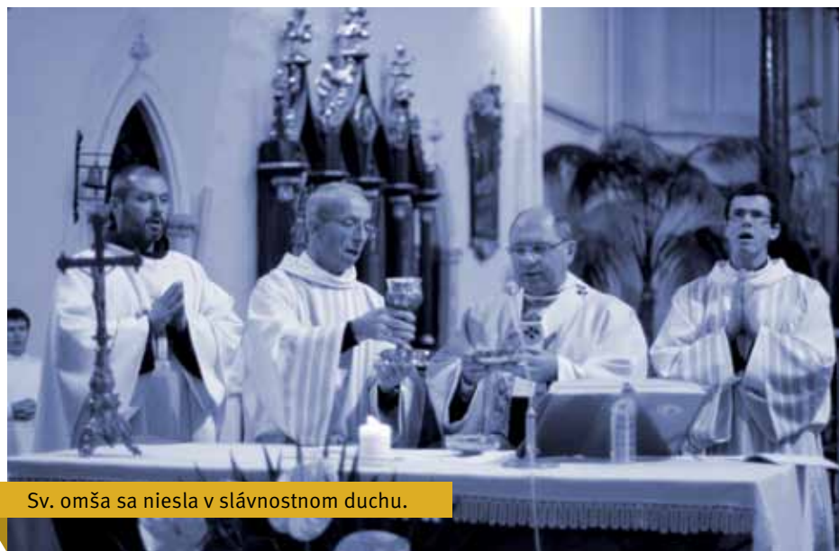
Sv. omša sa niesla v slávnostnom duchu.