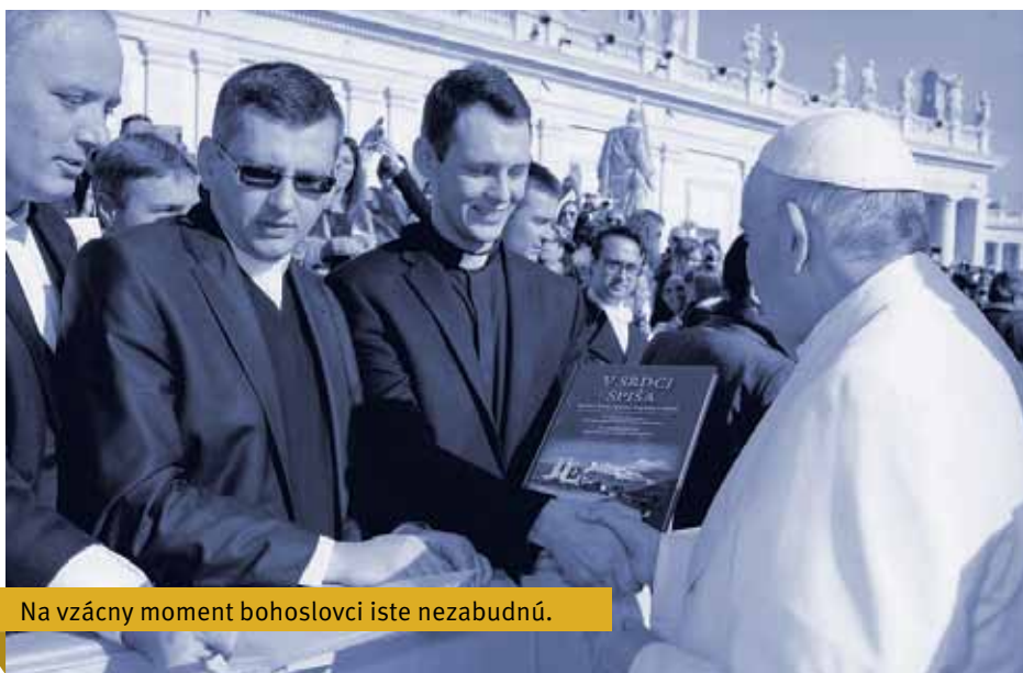
Na vzácny moment bohoslovci iste nezabudnú.

kupmi v Lateránskej bazilike a cestou naspäť si pozreli Benátky, kde ich srdečne prijali a pohostili vo farnosti Panny Márie Karmelskej.