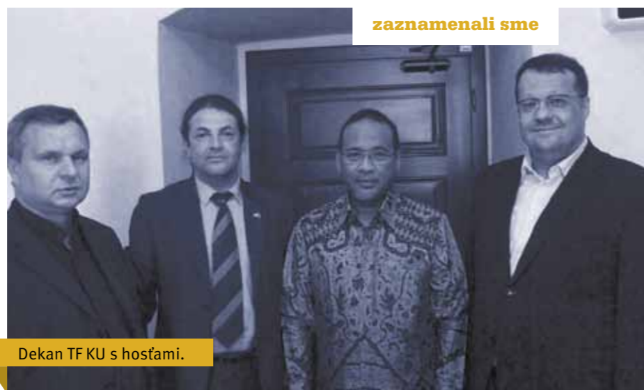
Dekan TF KU s hosťami.