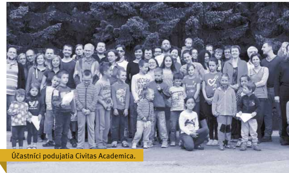
Účastníci podujatia Civitas Academica.