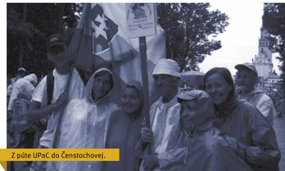
Z púte UPaC do Čenstochovej.

Vchádzame cez bránu nového akademického roka 2014/2015, v ktorom Vám chcem odovzdať srdečný pozdrav a popriať chuť do štúdia, čas na dobrých priateľov a ochotu podeliť sa so svojimi talentami.